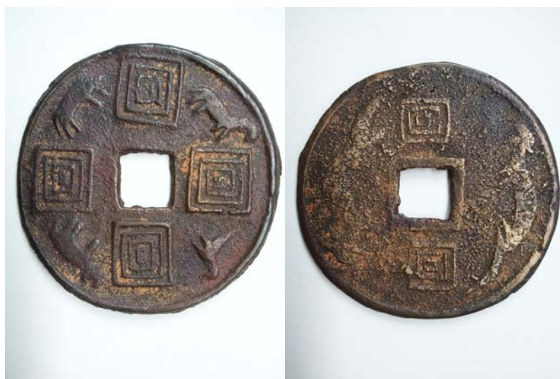
图 6：正面回字纹水族“水书”象形文字 背面回字纹双龙图