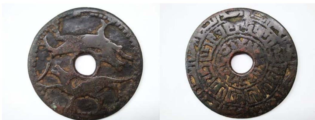
图 8 正面双龙边珠圈 背面十二生肖图