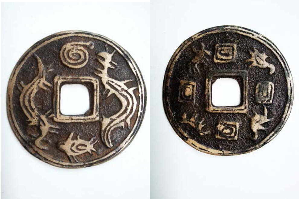
图 4：正面双龙图（鱼化龙）背面为水族“水书”象形文字