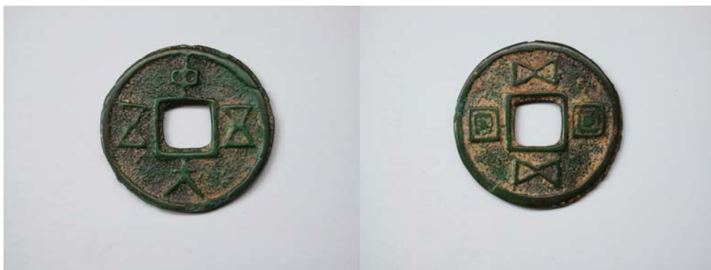
图 1：带记值的水族“水书”“中大”系列钱币 中大五五 正面和背面

贵州省学者上世纪末在研究民俗钱币过程中，发现了极具地域特色的水族民俗钱币，并在中国民俗钱币收藏界中首次提出了水族“花钱”概念。经过十多年的研究整理，目前水族民俗钱币已整理出多个系列达二十多个品种。其中有带记值的水族“水书”“中大”系列钱币，无记值的带龙图和人牵牛耕图的“中大”系列民俗钱币，带双龙图或“水书”动物图（动物为水族文字“水书”），回字纹图以及珠圈（内环珠圈及边珠圈），的“水书”其它系列民俗钱币作为在古代中国未曾建立过少数民族政权的水族，能够铸造、留存下来如此之多种类的民俗钱币品种，这在中国少数民族的文化遗存中，堪称一绝。