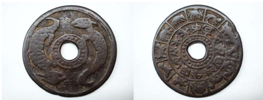
图 7：正面 双龙内环珠圈 背面十二生肖