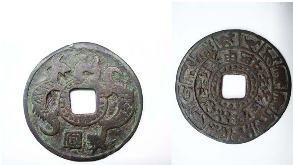
图 5：正面回字纹内环环珠圈双人 背面十二生肖内环珠圈