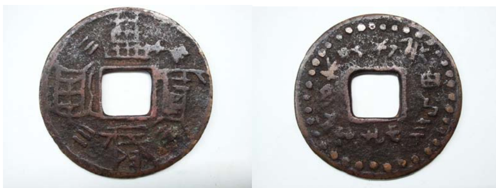
图 9：正面汉文倒书 万历通宝 背面外珠圈水书十二生肖

“水书”是水族先民用类似甲骨文和金文的一种古老符号，是迄今世界上仍活着的古老象形文字，是中国乃至世界民族文化宝库中罕见的一份文化遗产，它与远古汉文字甲骨文、金文有着同时代、同渊源的关系。2006 年 6 月“水书”