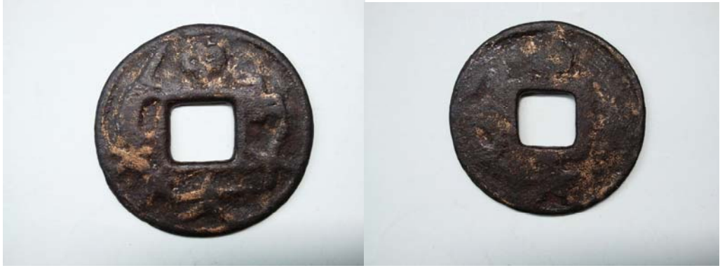
图 2：无记值带龙和人牵牛耕图的“中大”系列民俗钱币正面和背面