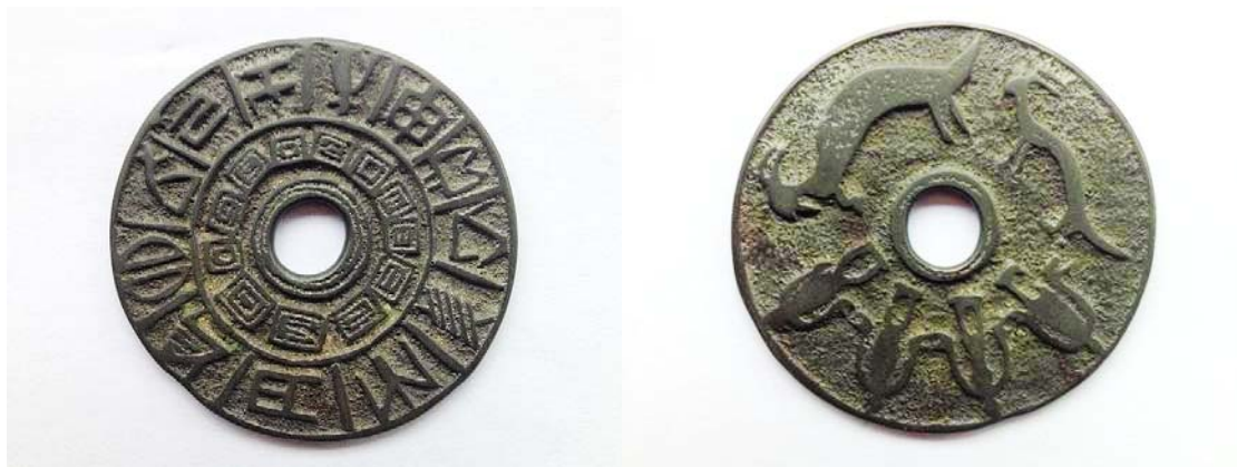
图 13：正面水族端节钱币四人牵手图 背面十二生肖图

十二生肖对应的文字。中国民俗钱币学会会长陆昕 2009 年 10 月 8 日在国家级杂志《艺术市场》上发表的《中国古代民俗钱币的收藏与研究》论文中特别提到：“贵州的泉友对当地所独有的水书民俗钱币进行了发掘整理，是地方民俗钱币研究上的一个亮点。”这是对黔南民俗钱币收藏、研究者给予的充分肯定。