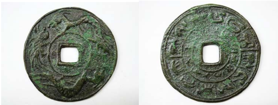
图 3：正面双龙图（鱼化龙）背面为 12 生肖